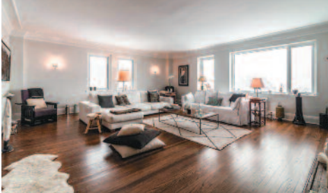
Gleneagles 3940 ch. de la Côte-des-Neiges, A51 5 975 $/mois-month