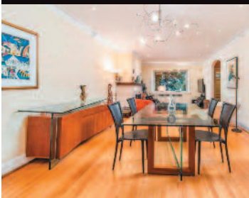
Adj. Westmount 4937 ch. Circle 1 139 000 $