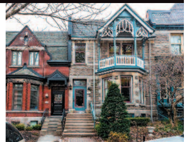
Westmount 102 ave Columbia 1 150 000 $

L'EXPERTISE L'EFFICACITÉ L'EXCELLENCE LA SOLUTION LE SERVICE LE SUIVI