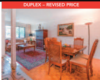
Saint-Laurent 2670-2672 rue Cazeuene 699 000 $