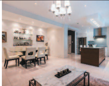
McGregor building 1700 ave du Docteur-Penfield, #24 750 000 $ 3 bdrms/c.à.c. – 2 baths/s.d.b.