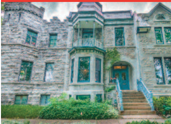
Westmount 3 rue Prospect 998 000 $ 4 bdrms/c.à.c. – 2+1 baths/s.d.b.