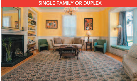
Westmount 4172 boul. Dorchester O. 1 035 000 $