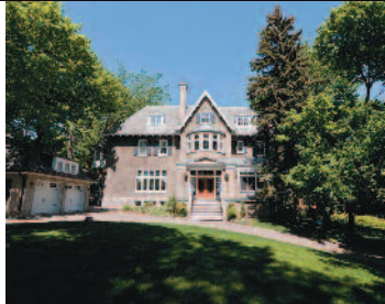
Westmount 519 ave Clarke 3 450 000 $ 6 bdrms/c.à.c. – 4+1 baths/s.d.b.