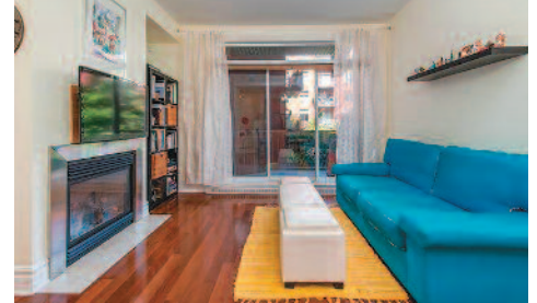
Le Plateau Mont-Royal 1311 rue Saint-Grégoire, #109 265 000 $