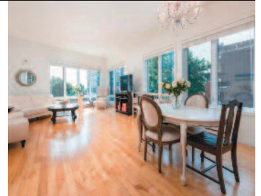
Le Plateau Mont-Royal 2159 rue Sherbrooke 330 000 $ 1 bdrm/c.à.c. – 1 bath/s.d.b.