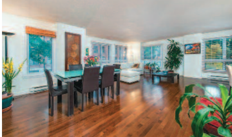
Le Sud-Ouest 2645 rue Rufus-Rockhead, #C-204 449 000 $