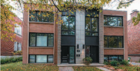
Notre-Dame-de-Grâce 6162-6164 rue de Terrebonne 899 000 $

MAISON FAMILIALE OU DUPLEX SINGLE-FAMILY OR DUPLEX