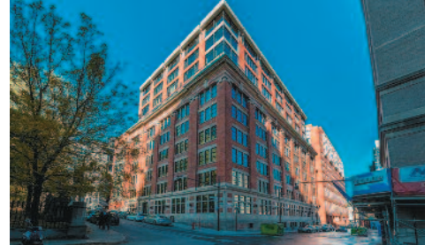
Ville-Marie 1061 rue Saint-Alexandre, #901 485 000 $