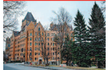
Gleneagles 3940 ch. de la Côte-des-Neiges À partir de/Starting at 630 000 $

PLUSIEURS UNITÉS DISPONIBLES MULTIPLE UNITS AVAILABLE