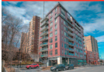
Forest Hill 4500 ch. de la Côte-des-Neigess À partir de/Starting at 275 000 $

PLUSIEURS UNITÉS DISPONIBLES MULTIPLE UNITS AVAILABLE