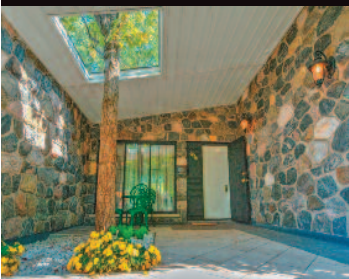
Montréal-Nord 12581 ave Hector-Lamarre 399 000 $