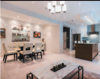
McGregor Building 1700 ave du Docteur-Penfield, #24 750 000 $ 3 c.c./bdrms – 2 s.d.b./baths

PLUSIEURS UNITÉS DISPONIBLES MULTIPLE UNITS AVAILABLE