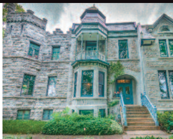
Westmount 3 rue Prospect 998 000 $