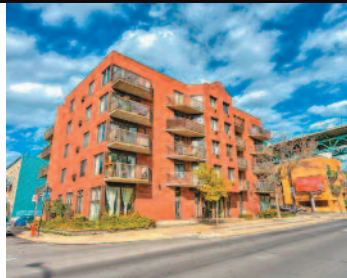
Ville-Marie 1955 boul. René-Lévesque E., #404 225 000 $ 1 c.c./bdrms – 1 s.d.b./baths